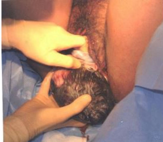
Figure 7 : explusion. Recherche d'un circulaire du cordon dans le sillon du cou

Une fois la tête complètement dégagée, l'opérateur doit s'assurer de l'absence d'un cordon circulaire au cou. Dans le cas contraire, il doit soit le faire glisser autour de la tête fœtale voire l'ignorer (s'il est lâche) soit le couper (s'il est serré)